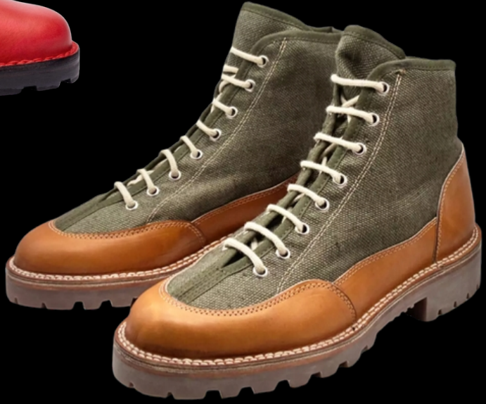
La Manufacture Bontemps