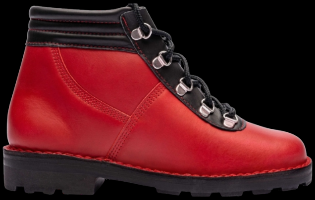
Chaussure de Gatine

Dans cette tendance, les codes de l'outdoor, du sport et de l'équipement technique fusionnent autour de semelles ergonomiques, de systèmes de fermetures hybrides (lacets techniques, scratchs, zips visibles), de matières performantes, respirantes ou déperlantes mais tout est retravaillé dans une logique urbaine, stylisée, esthétique qui dépasse la pure performance. Sneakers hybrides, sandales techniques réinterprétées pour la ville, bottines profilées, et modèles modulables sont les nouvelles stars de l'hiver.