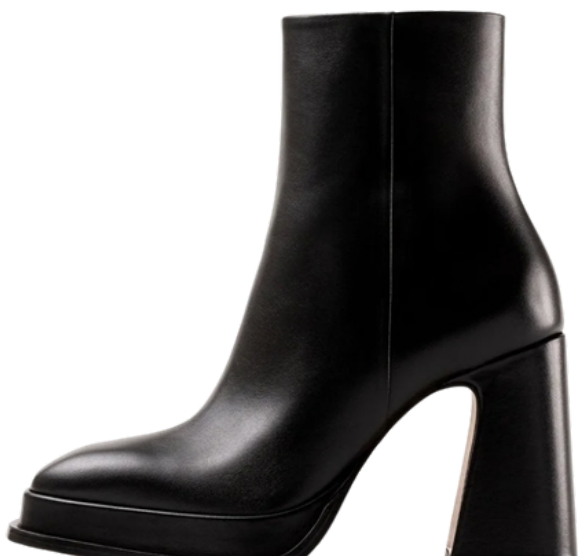
MRTNZ Souliers Martinez