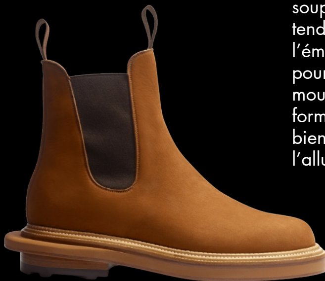
J.M. Weston X Sacai

Face aux silhouettes enveloppantes et structurées, une nouvelle génération de chaussures introduit plus de souplesse et d'adaptabilité. Une tendance qui marque l'émergence d'un design pensé pour accompagner le mouvement réel. Une autre forme de luxe, où l'usage et le bien-être priment autant que l'allure.